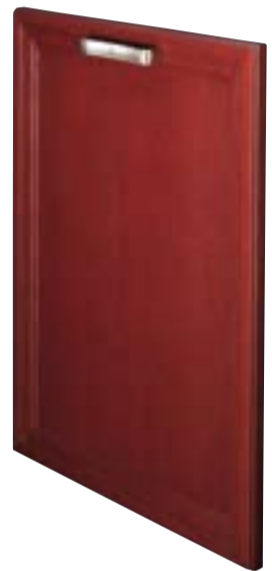
Anta telaio Framed door Porte avec cadre Front mit Rahmen Puerta con bastidor