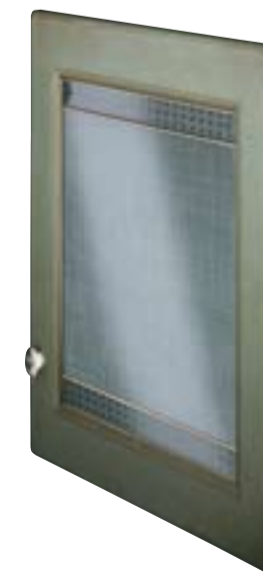
Anta telaio con vetro Framed door with glass Porte vitrée avec cadre Front mit Rahmen und Glasfüllung Puerta cristal con bastidor