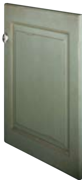
Anta telaio Framed door Porte avec cadre Front mit Rahmen Puerta con bastidor