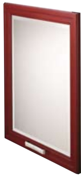
Anta telaio con vetro Framed door with glass Porte vitrée avec cadre Front mit Rahmen und Glasfüllung Puerta cristal con bastidor